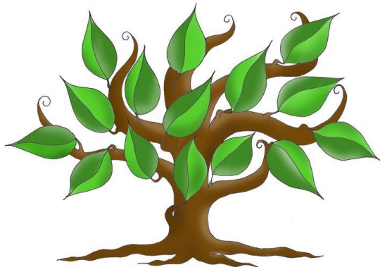
My Family Tree

ENCOURAGE YOUR CHILD TO LEARN PRAISE him when he does well Don't make an issue out of mistakes HELP your child when she needs it